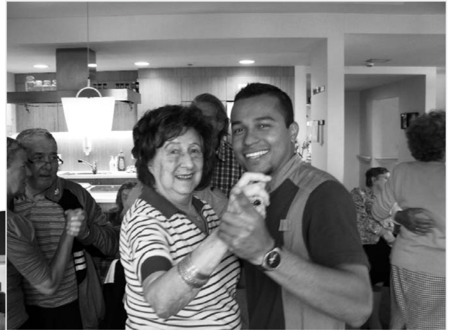
dansen in het dagcentrum ...