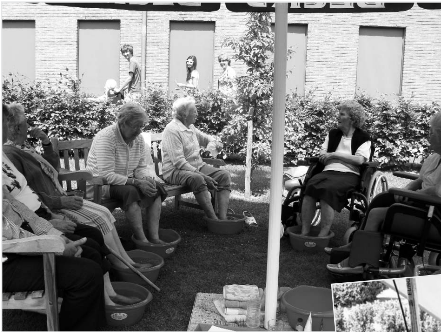
zomerse verwennerijen wellness onder de parasol op het binnenpleintje van de kleinschalige woningen en muziek onder de grote zonneluifel aan het Grand Café...