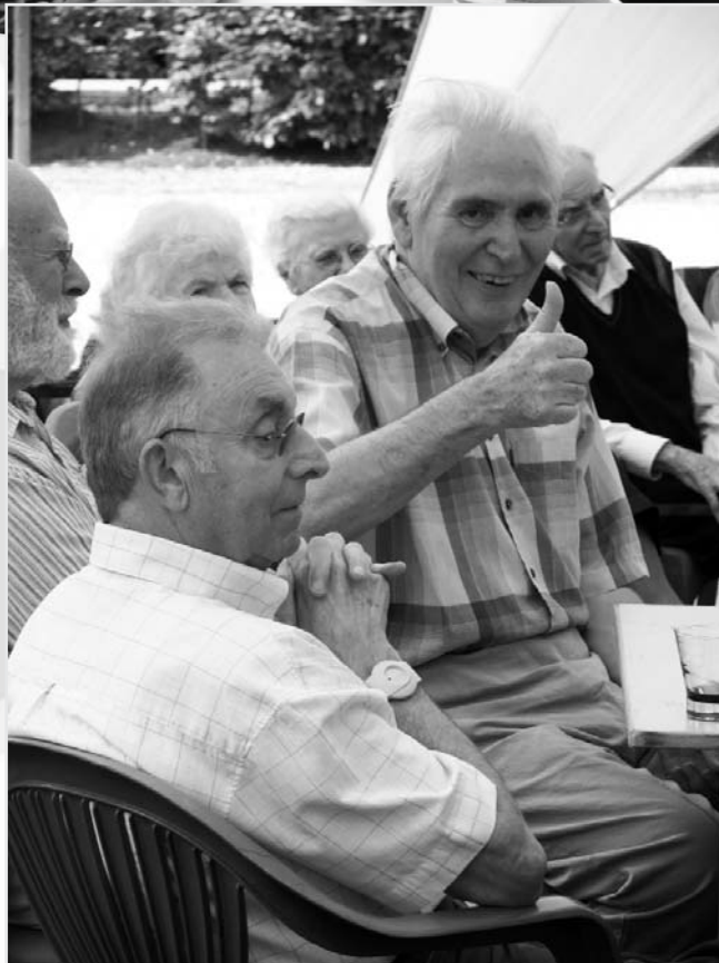
donderdag 18 augustus 2011: groep "t Jaske" pleziert de bewoners en toehoorders met swingende accordeonmuziek en gekende liedjes uit vroeger dagen